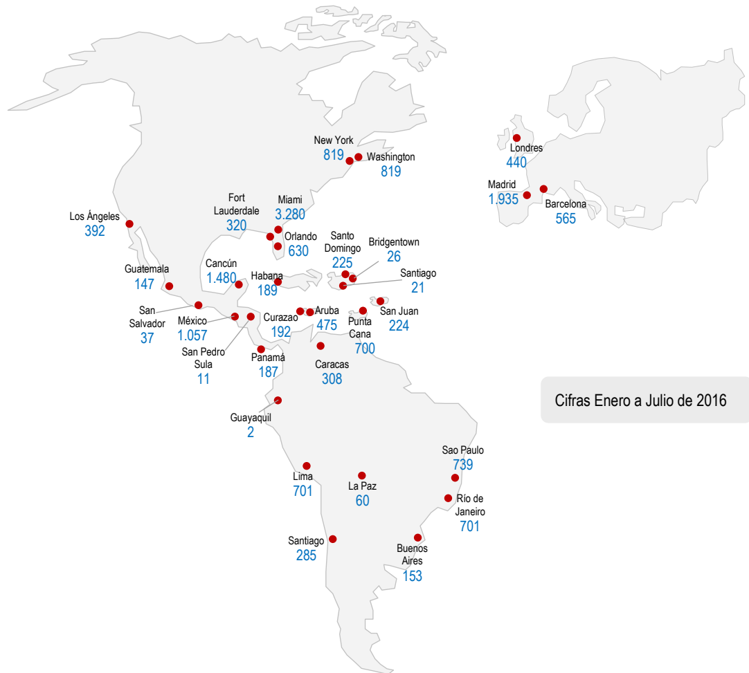
Cifras Enero a Julio de 2016